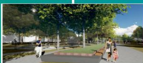
Сквер им. П. Морозова Орджоникидзевский район