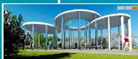
Объект озеленения по ул. Макаренко Мотовилихинский район