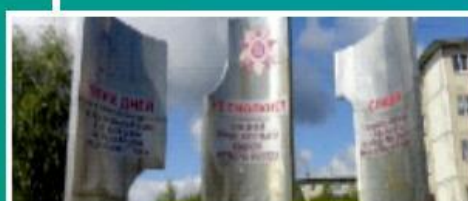
Сквер «Мемориал победы» п. Новые Ляды