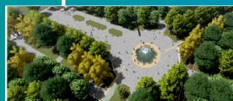
Сквер у клуба им. С. М. Кирова Кировский район