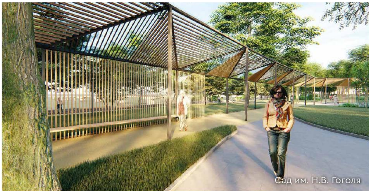
Сад им. Н.В. Гоголя

Голосование по выбору объектов благоустройства – это возможность каждого решить, какие изменения должны произойти в вашем городе.