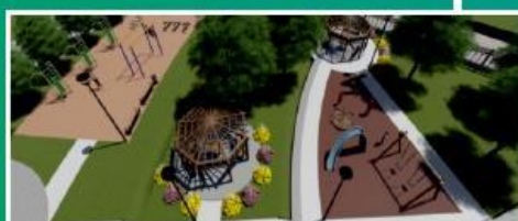
Сквер Победителей Свердловский район