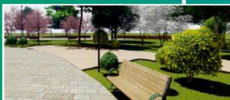
Сквер у здания по ул. Советской Армии, 4 Индустриальный район